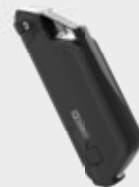
Display con Bluetooth