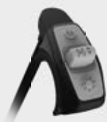
Unità di comando wireless